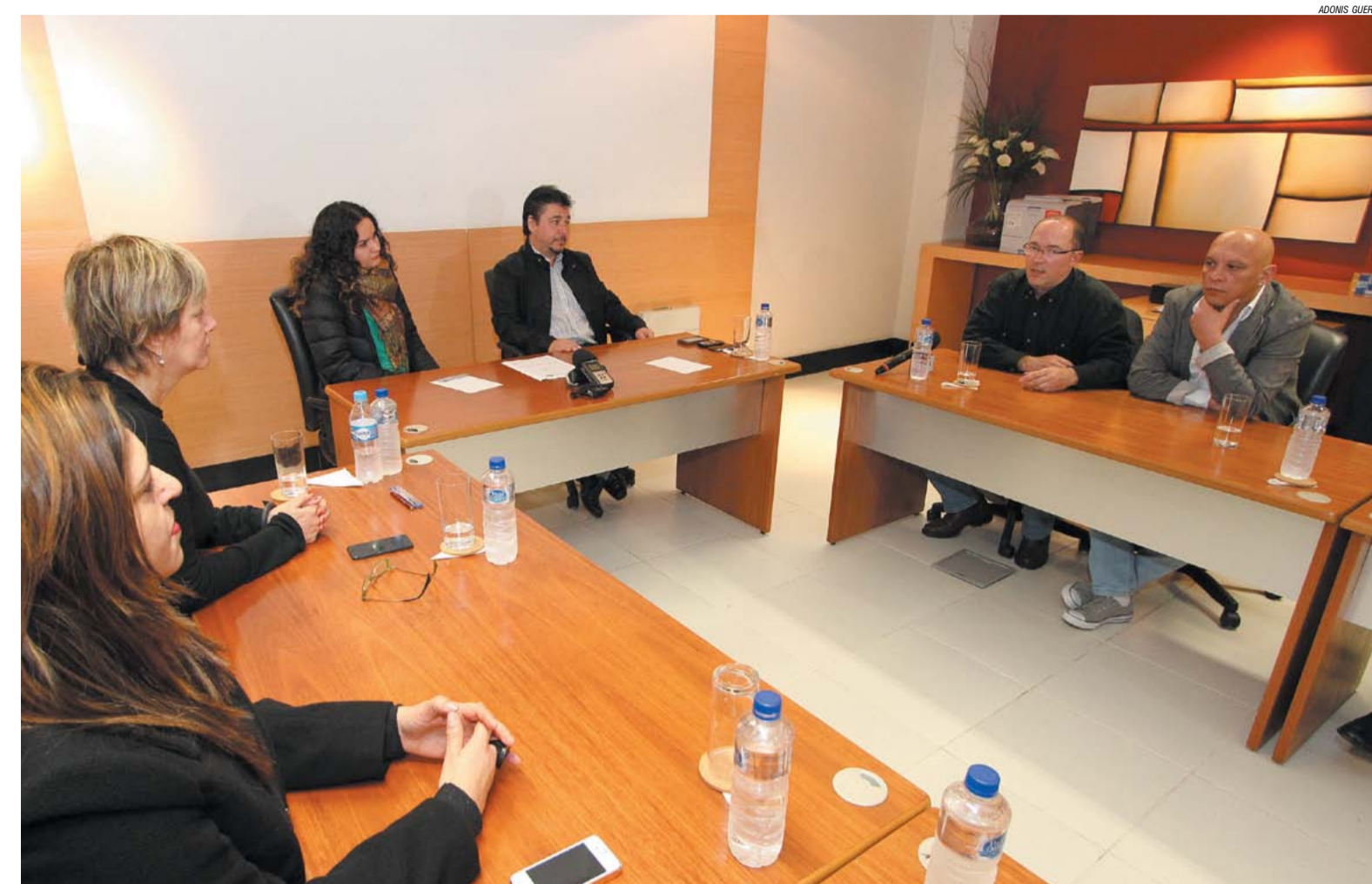
Reunião de assinatura do acordo entre as duas entidades sindicais